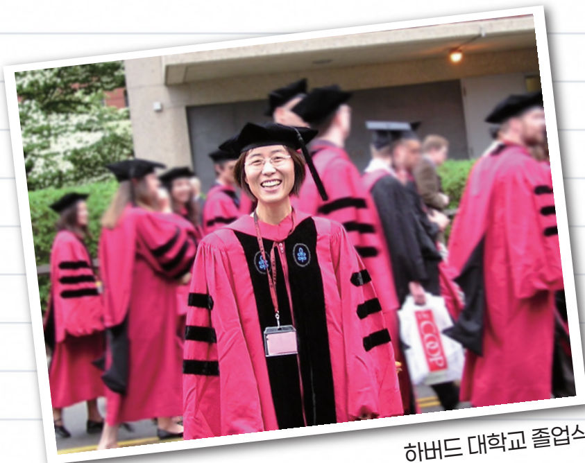
하버드 대학교 졸업식