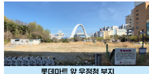
롯데마트 앞 우정청 부지