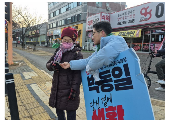
주민의 삶을 바꾸어 가고 믿음을 주는 주민 결의 생활정치 활동