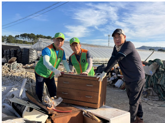
농촌지역 수해 피해 복구 현장 활동