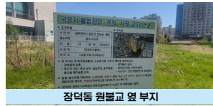
장덕동 원불교 옆 부지