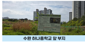
수완 하나중학교 앞 부지