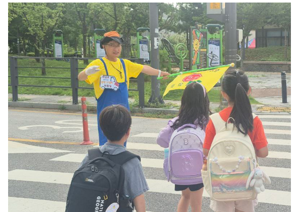
초등학교 등굣길 안전지킴이 역할 톡톡하게