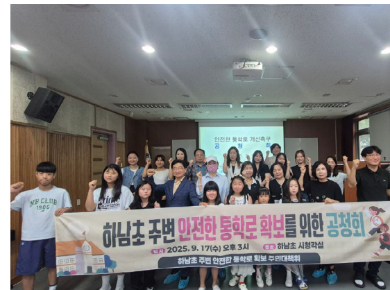
하남초등학교 안전한 통학로 확보를 위한 학생, 학부모, 교사, 주민들과 공청회 개최