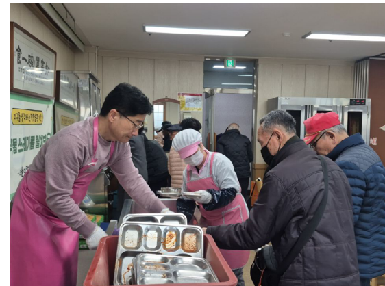
매주 목요일 어르신 급식봉사 활동