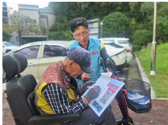
횡단보도 진출입 등 장애인 편의시설 확충 설문 대중교통 환승시간 연장서명