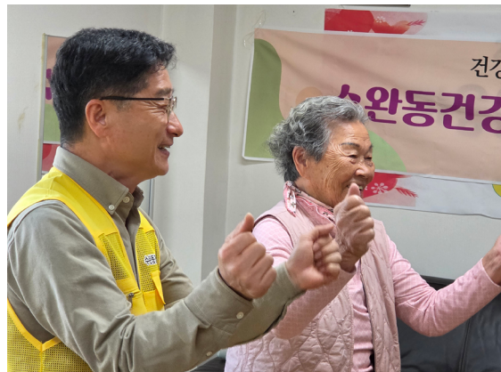
건강한 노후를 보낼 수 있도록 건강활동 지원