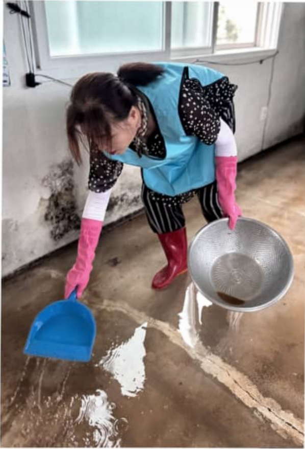
건국동 해산마을 경로당 수해복구 활동