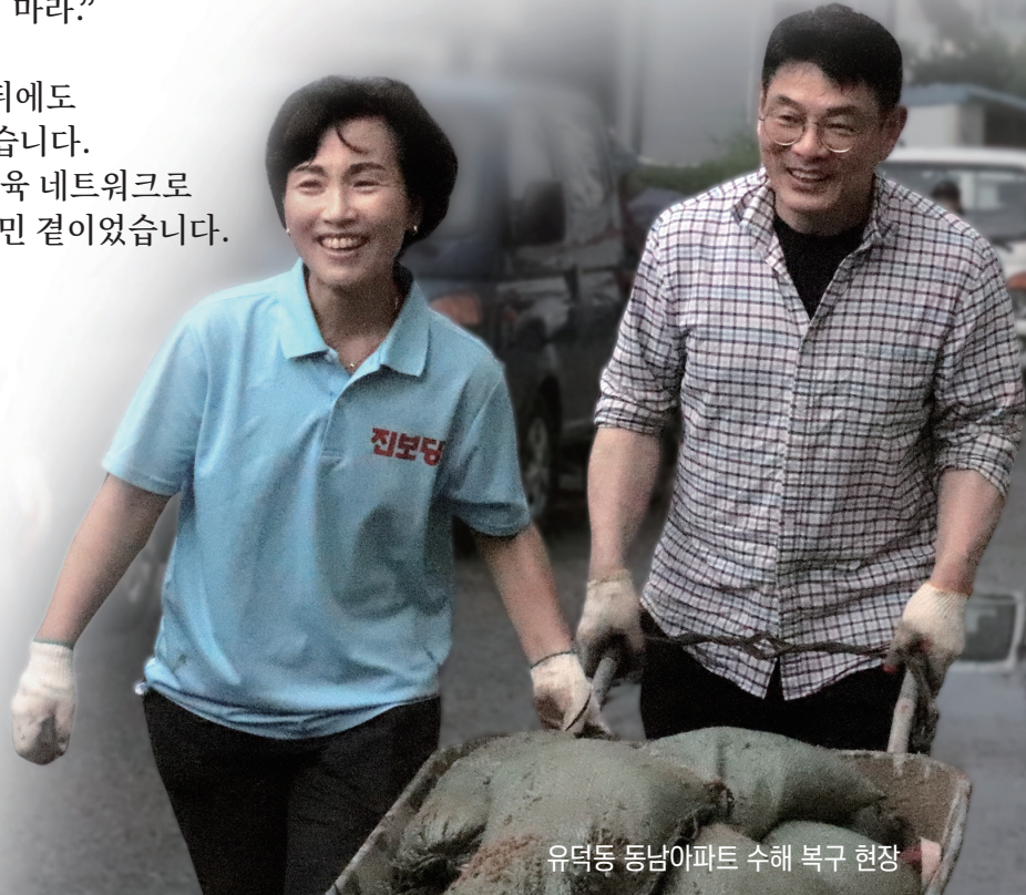
유덕동 동남아파트 수해 복구 현장