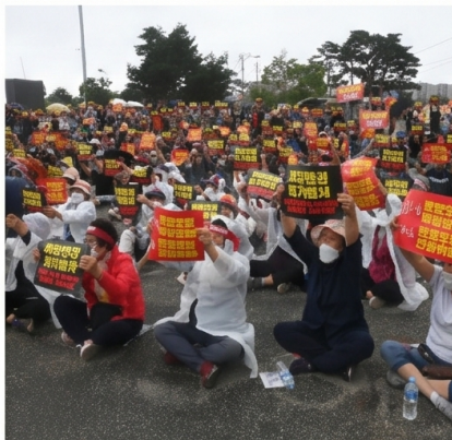
[폐기물 처리장 집회 현장] 수많은 주민들의 한결같은 염원