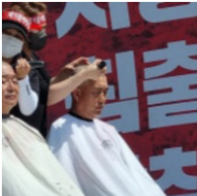
[식발식 현장] 주민들의 생존권을 위한 굳은 결의