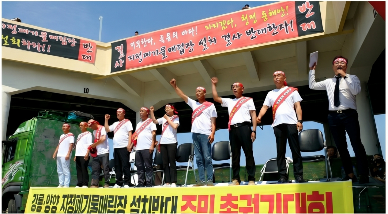
[주민 총궐기대회 현장] 지역주민들의 강력한 의지를 앞장서 대변했습니다.