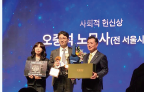
미국 루즈벨트 재단 제1회 한국 '테디스 어워즈' 사회적 헌신상 수상