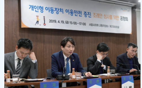
서울시 행정사무감사 우수의원