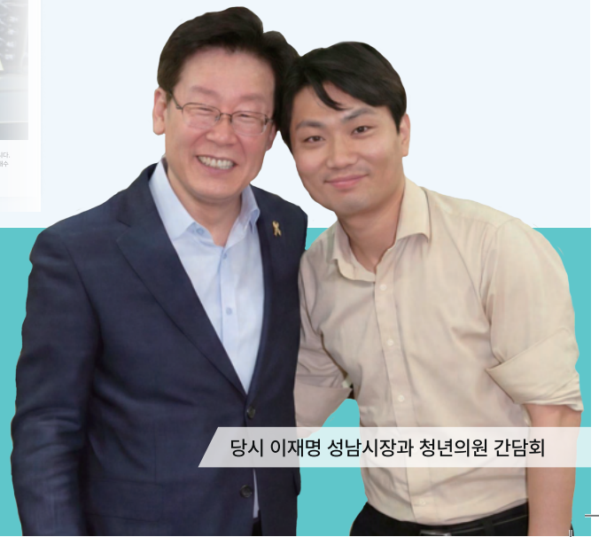
당시 이재명 성남시장과 청년의원 간담회