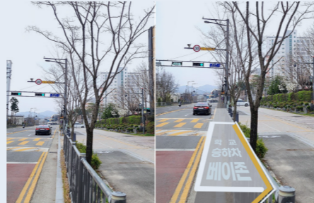
초등학교 승하차 구역 조성