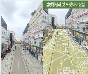
문화·경관 명소화 특화거리 조성