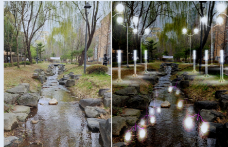
밤이 더 아름다운 실개천 수중조명 설치