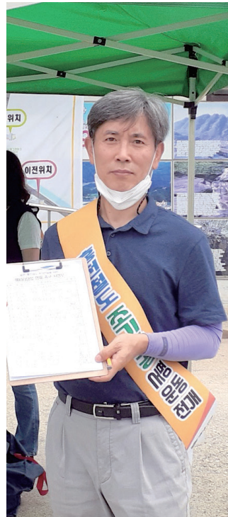
홍천철도 유치 서명 캠페인