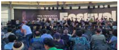
행구 주민자치위원회 주최 축제 2026 도비 반영