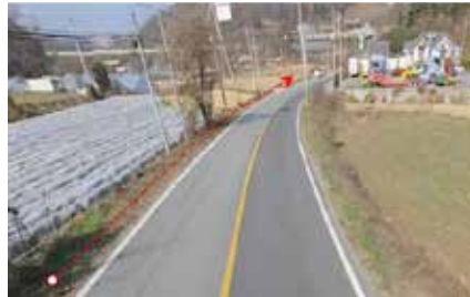
소초면 장양리 농어촌도로(소초 206호선), 수암1리(갯바위마을)도로 확포장 설계 용역 도비 지원