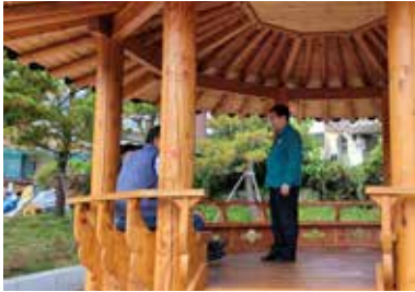
원주초등학교 학부모회 통학버스 지원 간담회