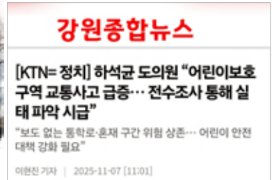
어린이보호구역 실태조사 및 개선촉구