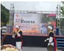
소초면 왕발걸음축제 도비 반영