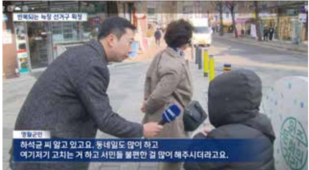
2026년 2월 23일 원주mbc 뉴스

- 조례발의 : 강원특별자치도 새마을장학금 지급 조례 일부 개정조례안 외 6건