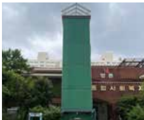
명륜종합사회복지관 지붕 교체