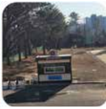
원주여중 나무심기 지원