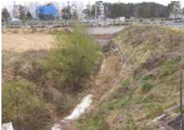
행구동 1842-55 땀길리들 도비 지원