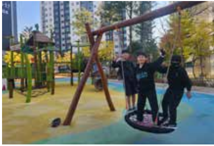
봉산동 동산어린이공원 리모델링 도비 지원 (삼익A와 동신A사이)