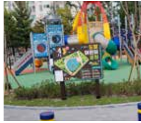
개운동 도말어린이공원 리모델링 도비 지원