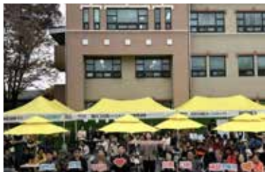
가톨릭종합사회복지관 편의시설 지원