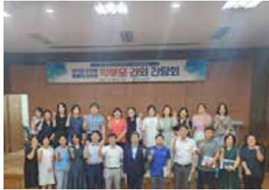
기계체조부 학부모회 간담회