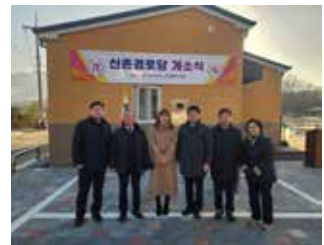
소초면 평장2리 신촌경로당 신설