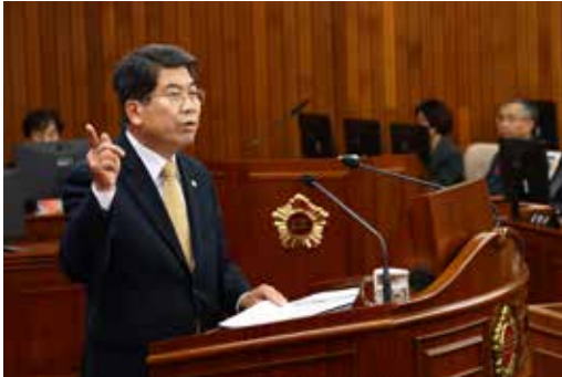
현) 강원특별자치도의회 의원