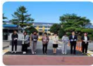
명륜초등학교 교문 개선 사업비 지원