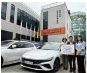
밥상공동체 복지관 노후 차량 교체