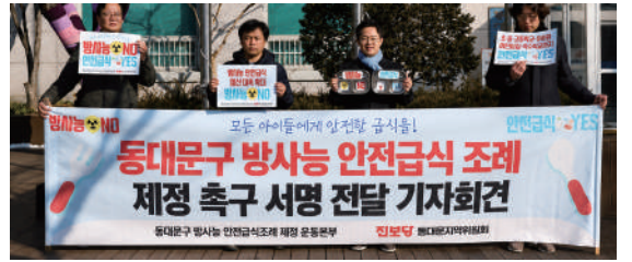
동대문구 방사능 안전급식 조례 제정 촉구 서명 전달