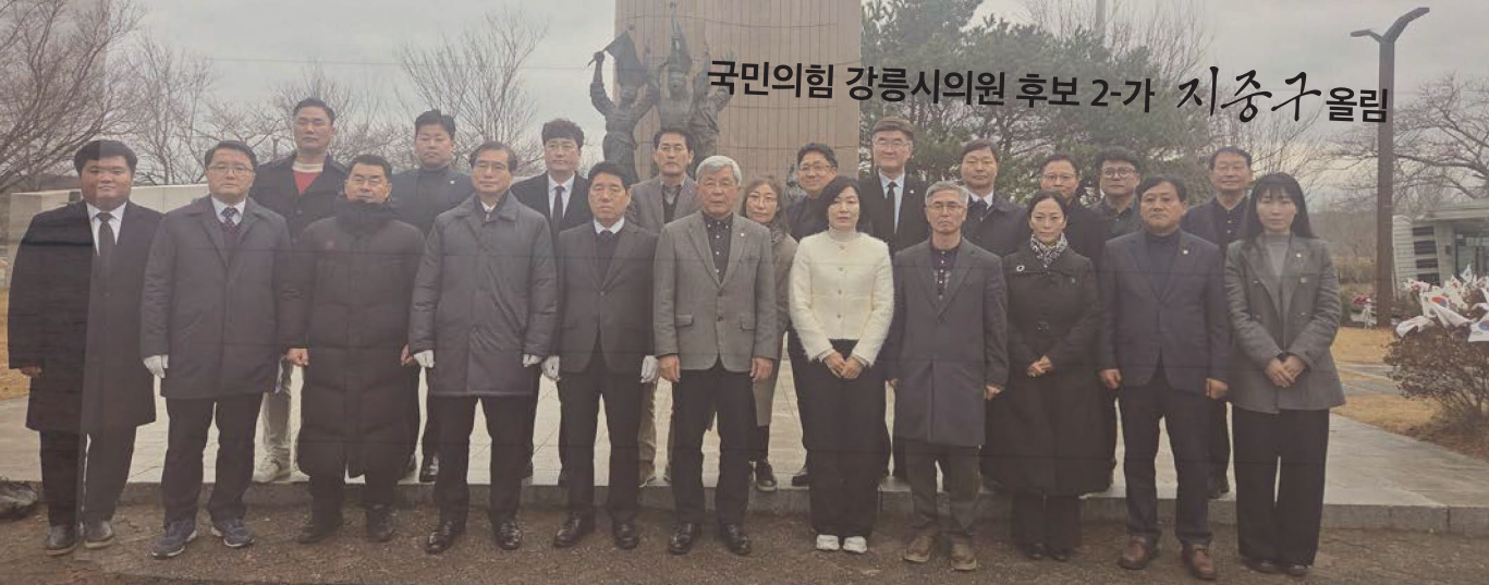
국민의힘 강릉시의원 후보 2-가 지중구 올림

시민 여러분의 곁에서, 시민의 마음을 가장 잘 헤아리는 든든한 일꾼이 되겠습니다. 강릉의 기분 좋은 변화, 지중구가 함께하겠습니다.