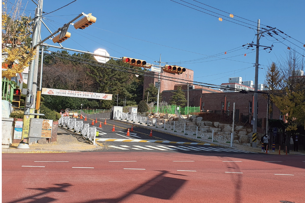
반송초 진출시 좌회전 신호체계 설치, 진입로 확장 (2022년도)