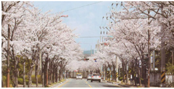
죽림신도시 전역 벚꽃나무 전량 식재(2006~2009)