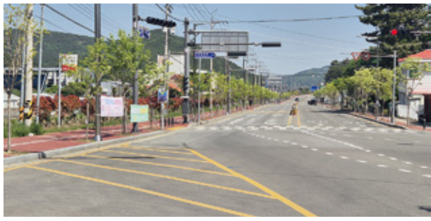
산양 세포-삼거리, 풍화일주도로 확포장