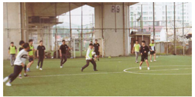
고속도로 밑 풋살, 광도테니스장 조성 추진