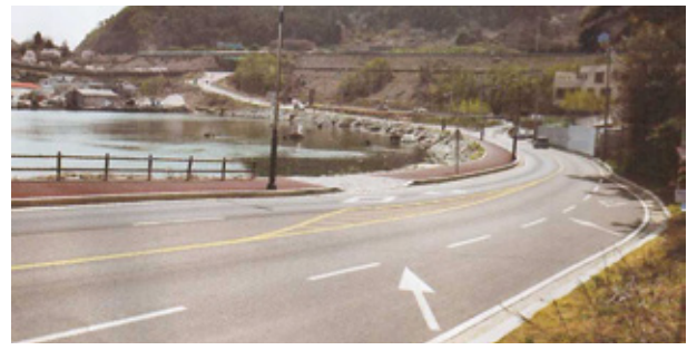
죽림~용남 기호간 해안도로 개설 추진