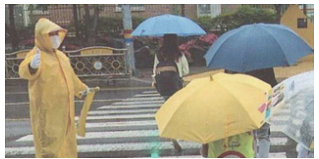
18여년 동안 죽림·제석초등학교 앞 교통봉사