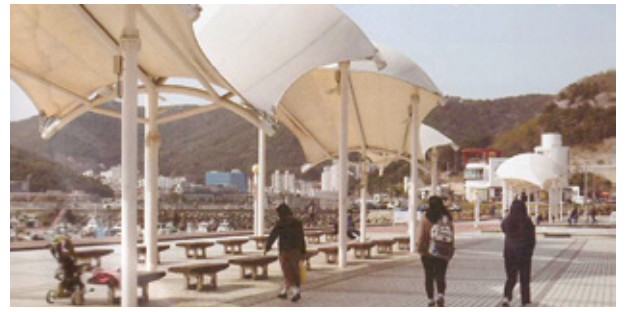
미수동 현대아파트 앞 해양관광공원 조성 추진