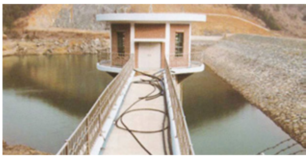
욕지면 식수댐 보강 추진(연화, 두미, 노대 등 수도공급)