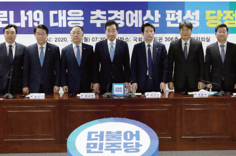
코로나19 대응 추경예산 편성 당정협의 (20.03.02)