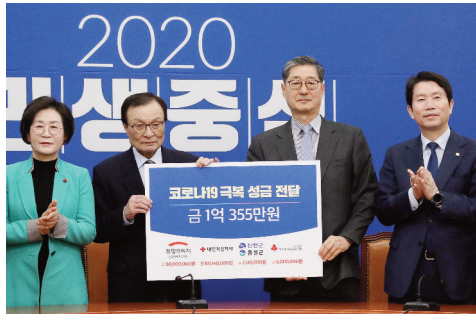
코로나19 극복 성금 전달식 (20.02.20)