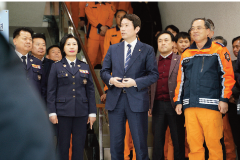
구로소방서 방문 (20.02.07)