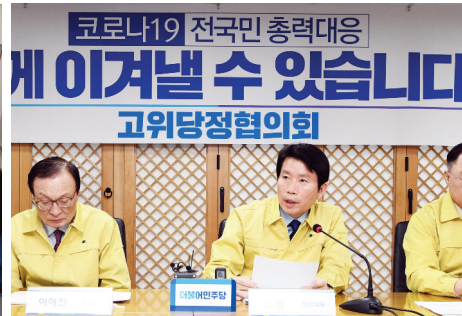
제3차 마스크 수급 안정화 고위당정협의회 (20.02.25)