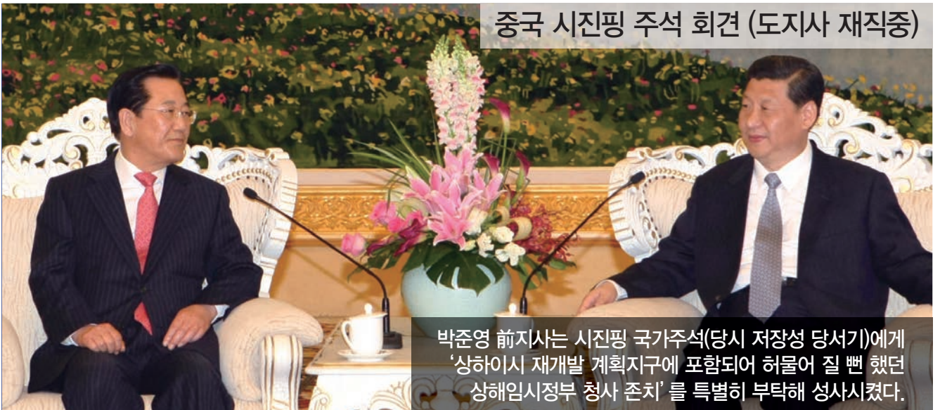
박준영 前지사는 시진핑 국가주석(당시 저장성 당서기)에게 '상하이시 재개발 계획지구에 포함되어 허물어 질 뻔 했던 상해임시정부 청사 존치'를 특별히 부탁해 성사시켰다.