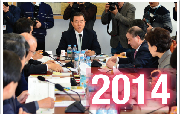
▶ 국회 예산결산특별위원회 위원장 국가 총 예산 375조원을 편성 심의하는 막중한 자리에 올라 국가예산을 적재적소에 맞게 편성했습니다.