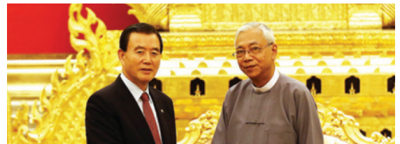
미얀마 틴조 대통령 회동 · 국내 선진화된 농업기술 전수제한 미얀마 틴조 대통령, 원민하원의장 회동