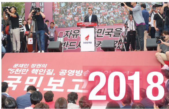
▶ 자유한국당 사무총장 대선 패배 이후 당을 살리기 위해 혼신의 힘을 다했습니다.