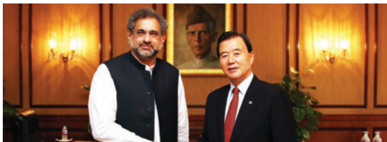
파키스탄 압바시 총리 접견 · 양국간 경제협력 약속 · 파키스탄 사디크 하원의장, 압바시 총리, 아시프 외교부 장관 접견