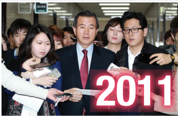
▶ 한나라당 최고위원 17대 충청권에서 유일하게 홀로 당선되어 대한민국 자유민주주의를 지켜왔습니다.