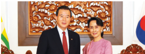
미얀마 민주화의 상징인 아웅산 수지 국가고문면담 · 한국기업 미얀마 진출을 위한 지원당부