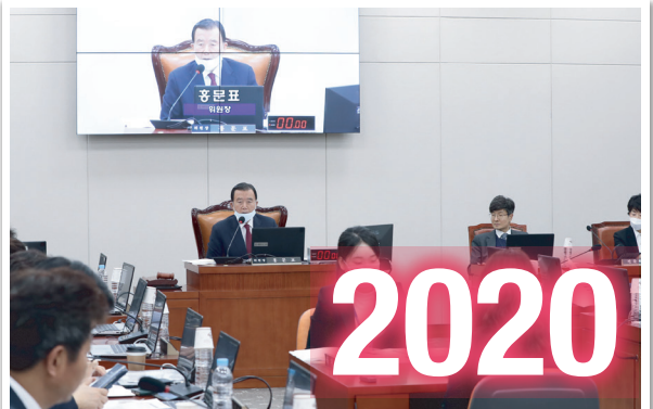
▶ 국회 교육위원회 위원장 백년지대계를 위한 대한민국 교육발전을 위해 최선을 다하고 있습니다.