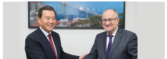
페트코 드라가노프 주한 불가리아대사 환담 · 한국-불가리아 의원 친선협회장 자격 · 한-불 수교 30주년 계기 양국의 공동번영과 발전 기원