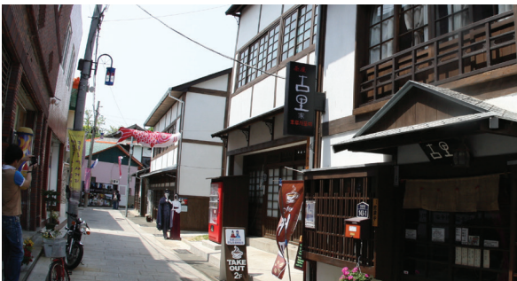
구룡포근대문화거리(동백꽃 필무렵 촬영지)