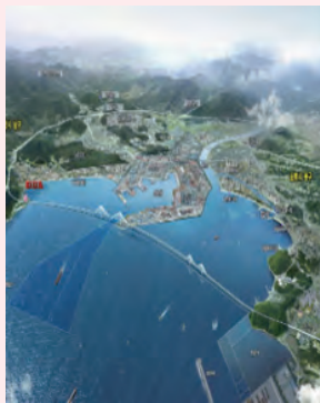
영일만대교, (가칭)동빈대교 관광자원화