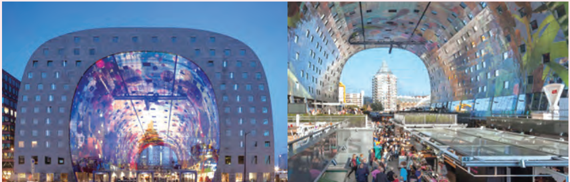
네덜란드 복합개발 사례(지상 복합 문화시설)