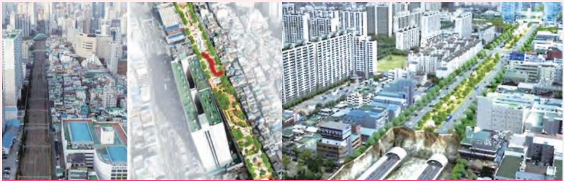
부산역 등 국내 철도 지하화 추진 사례

철도 소음/분진 발생, 도시발전 저해, 형산강 접근성 제한 등의 문제 발생 지상 유휴공간 복합개발로 주민생활편의 향상과 관광자원화 등의 도시발전 기대