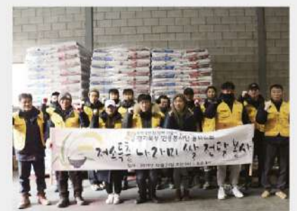
경기북부민중봉사단과 함께 어려운 이웃들에게 나라미 전달