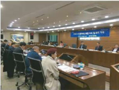
주민참여예산위원회 활동 의사결정의 민주성과 권한을 요구