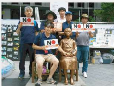
지역주민들과 함께 아베규탄 공동행동 개최