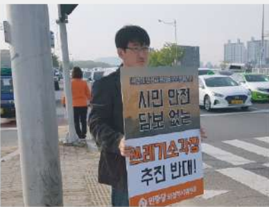
경기북부 주민들과 함께 자일동 소각장 강행을 막아냄