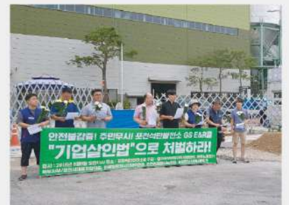
환경파괴, 건강권 침해하는 포천 GS석탄발전소 반대 행동