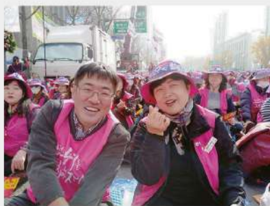
비정규직 차별에 당당히 맞선 학교비정규직 노동자들과 함께