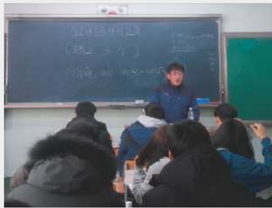
아르바이트 청소년 노동인권 교육 근로계약서 작성과 주휴수당 교육