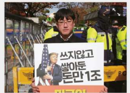
터무니없는 금액의 방위비분담금 요구하는 미국을 규탄하는 활동