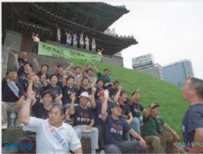
전두환, 노태우 구속처벌을 요구하며 1995년 남대문에 오르다