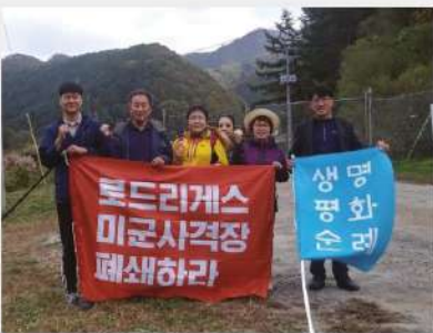
로드리게스 미군사격장 폐쇄 생명평화순례, 도보행진 3년째