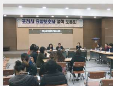
요양보호사 처우개선을 위하여 정책 토론회 개최