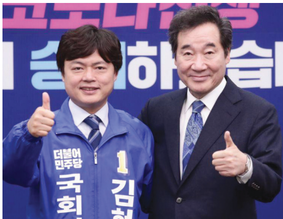
후원회장 이낙연 前국무총리