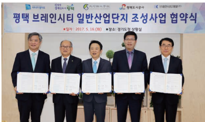
평택 브레인시티 개발사업을 재추진 했습니다!