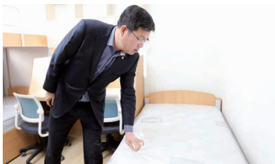
평택시 장학관 서울 수유동에 건립했습니다!