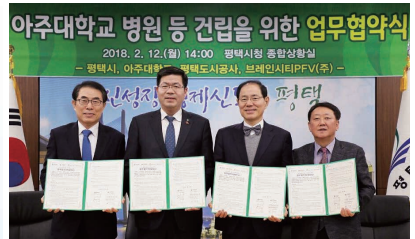
평택 아주대학교 병원 유치·건립 협약을 맺었습니다!