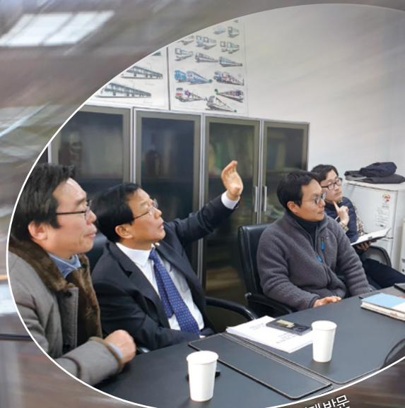
2020년 1월 29일 서울 과기대 방문

결국 관건은 'B/C'(경제성)입니다. 올해 후반기에 나오는 국토부의 용역 결과에 따라 최대한 신속하게 3호선 파주연장 사업이 추진될 수 있도록 최선을 다하겠습니다.