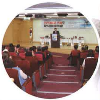
한산대첩교 건설을 위한 토론회 개최(11.12)