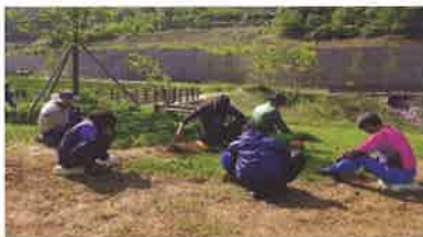
통영·고성 희망근로 지원사업