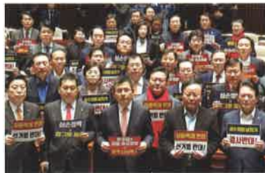
2대 약법 강행처리 규탄대회(12.23)