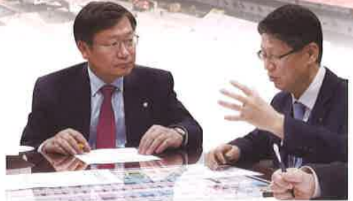
권우석 수출입은행 부행장 면담(11.26)

수출입은행장 등 관계자들과 수차례 협의하며 성동조선해양 관련 현안의 조속한 해결 필요성을 강조하는 등 성동조선 회생을 위해 노력하였습니다.