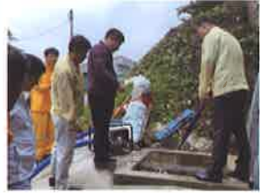
미진 이지비아 2차 인공 통로 박스 침수 방지 펌프 용량 확대 7억원