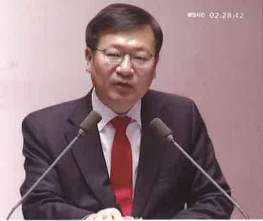
공수처 반대 필리버스터(12.28)