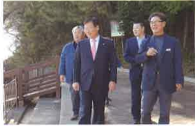
어촌뉴딜300 평가 현장 방문(11.15)