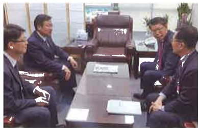
은성수 수출입은행장 면담(4.16)