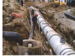
배수 펌프장 노후배관 교체사업 8억원 (특별교부세)