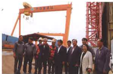
안정국가산업단지 퍼쉬기업 현장방문(9.10)