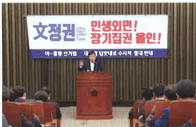
패스트트랙 부당성 설명(4.29)