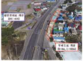
고성 월평리 거운마을 교차로 개선 20억원