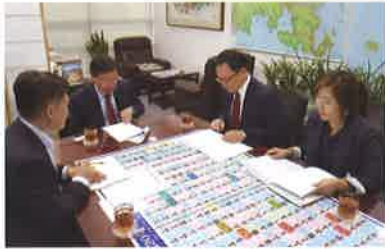
해양수산부 관계자 면담(10.22)