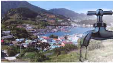
옥지도 식수원 개발사업