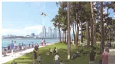
죽림 푸른 건강 숲(내죽도 공원) 조성 사업