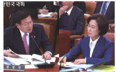
추미에 법무부장관 후보자 인사청문회(12.30)