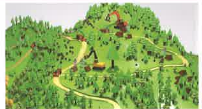
선도 산림 경영단지 선정