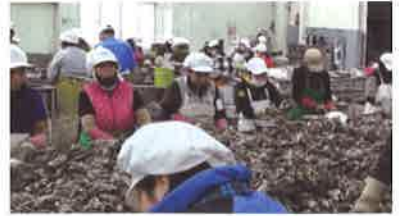
굴패각 친환경 처리 사업