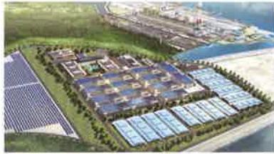
스마트양식 클러스터 사업