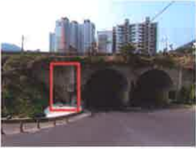
통영 용남면 미진 이지비아 2차 인공 통로 박스 확장 20억원