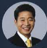
여영국 정의당 창원성산