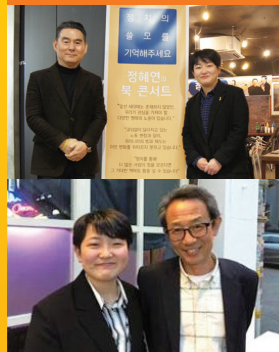
노무현 정부 (전) 청와대 경제 비서관

"평소에도 좋아했던 정혜연 후보가 노동자들의 새로운 대변자가 되길 바랍니다"