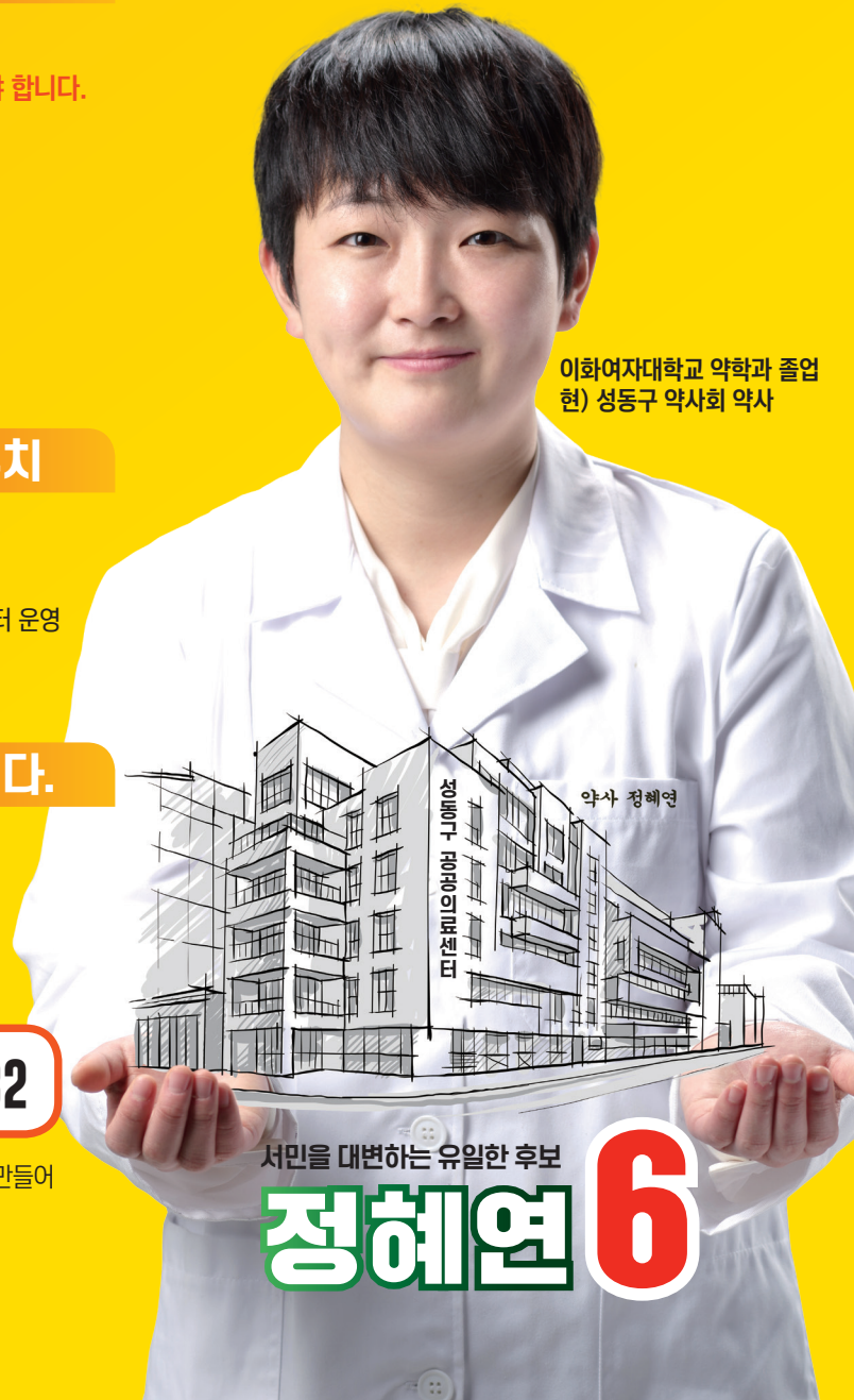
이화여자대학교 약학과 졸업 (현) 성동구 약사회 약사

정의당은 가장 먼저 코로나19 위기극복 119 민생센터를 만들어 생계위기에 빠진 분들을 돕기 위해 나섰습니다. 언제나 상담이 필요하신 분들은 연락주시기 바랍니다.