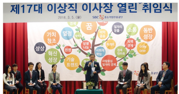
40년 중진공 역사상 첫 전북출신 이사장