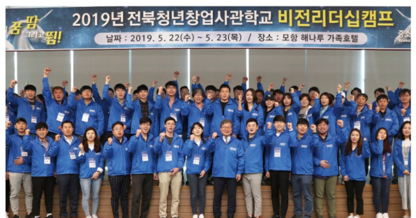
전북청년창업사관학교 전주 유치