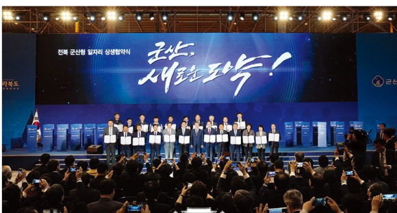
미래형 전기·자율차 '군산형 일자리' 1등 공신

전북의 BTS , 전주의 스티브잡스 를 키워내겠습니다! 매출 1조원 유니콘기업 씨를 뿌리겠습니다!