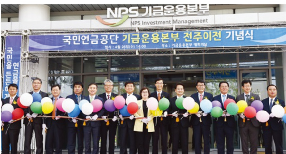
국민연금 기금운용본부 전주 이전