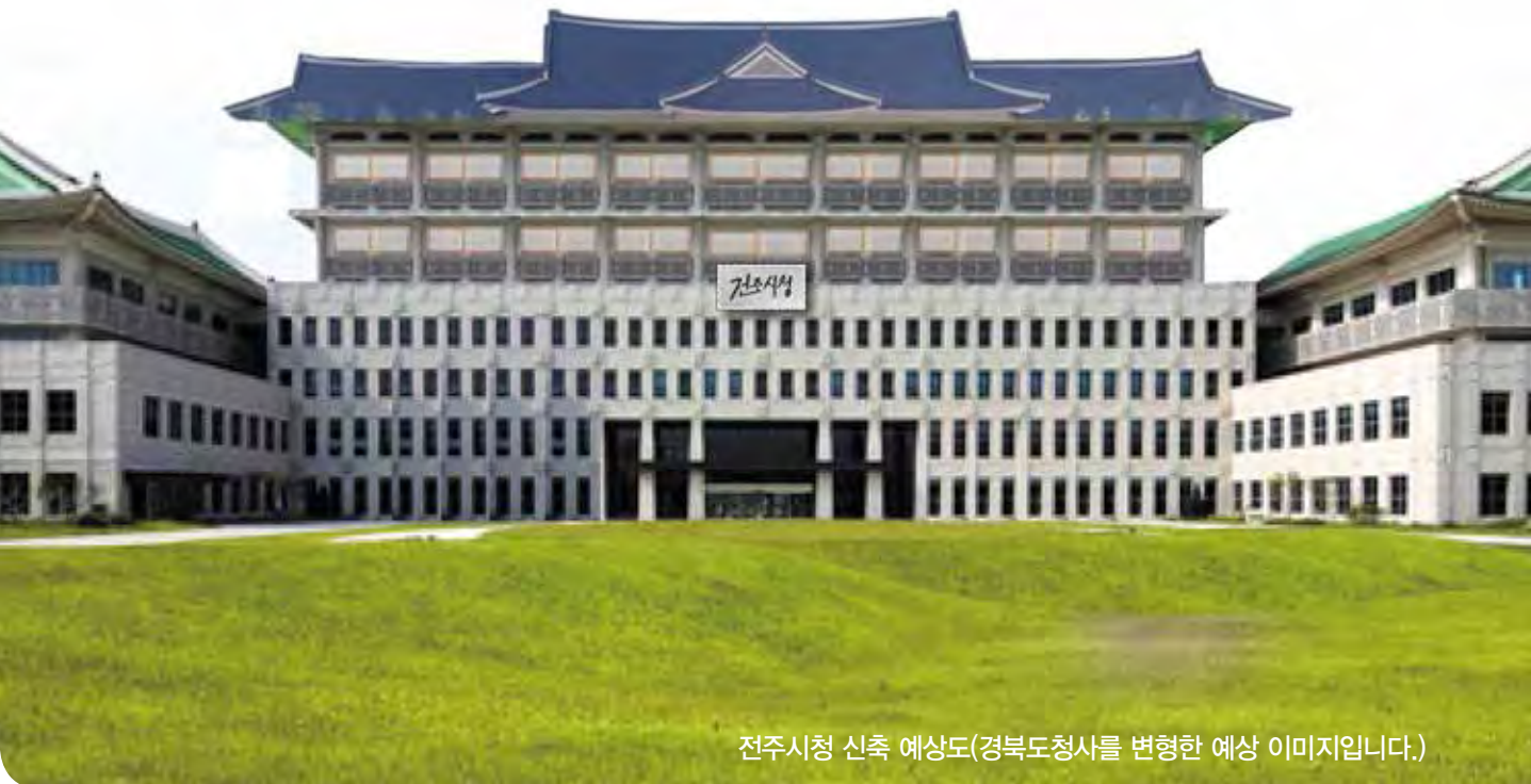
전주시청 신축 예상도(경북도청사를 변형한 예상 이미지입니다.)