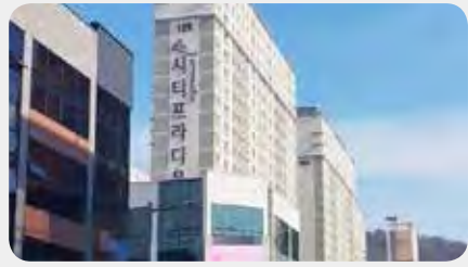
만성동 시티프라디움 지하주차장 승강기 설치