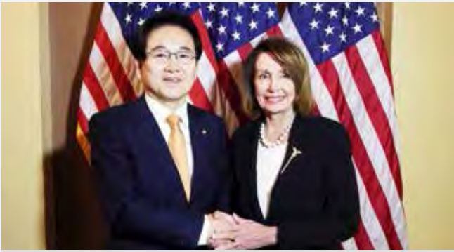
2019.02 미하원의장 낸시 펠로시 면담