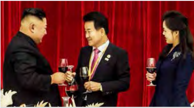
2018.09 평양 김정은 위원장 부부