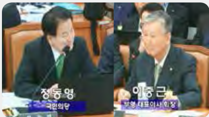
하가부영 임대료 인하