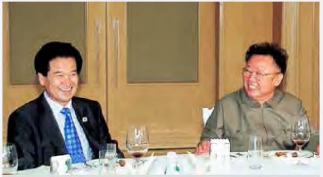
2005.06. 평양 김정일 위원장