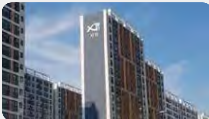
에코시티 자이1차 엘리베이터 소음 해결