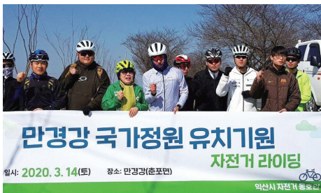
만경강 국가정원 유치기원 자전거 라이딩