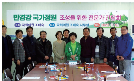
만경강 국가정원 조성을 위한 전문가 간담회