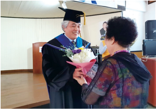
대한적십자사 익산 평생대학 시상식