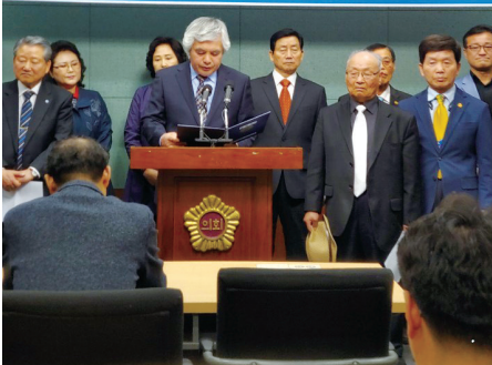
국민주권실천시민운동연합 공천제폐지 기자회견

초자치단체장 및 기초의회의원 공천제를 즉각 폐지하 국민주권실천시민운동연합