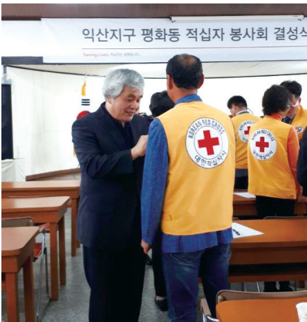
대한적십자사 익산 평생 대학장 봉사수여식

초자치단체장 및 기초의회의원 공천제를 즉각 폐지하 국민주권실천시민운동연합