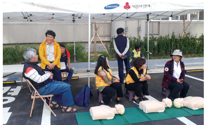
대한적십자사 익산지사 심폐소생훈련