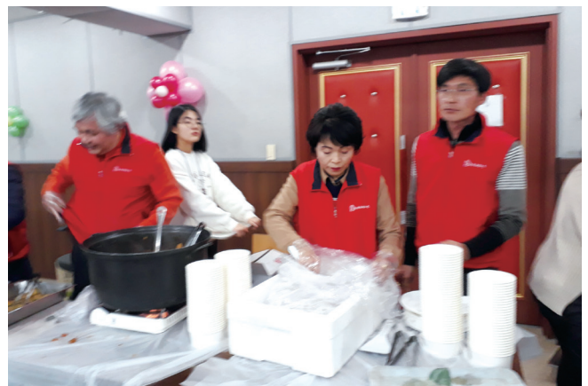
사) 크레파스 봉사 활동