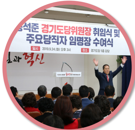
미래통합당 경기도당위원장 취임