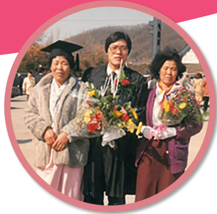
가족을 위해 평생 희생하신 어머니