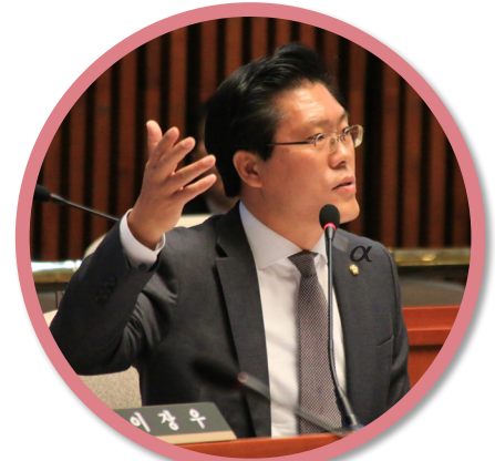
국회 예산결산특위에서 예산심사