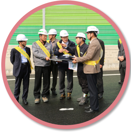
서울지방국토관리청장 시절 성남~장호원 자동차전용도로 조기 개통을 위한 현장지휘