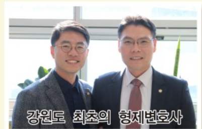
강원도 최초의 형제변호사

2015년 수도권보다 비싼 도시가스요금을 인하해 달라고 요구하며, 원주시민들 1만 4천명으로부터 서명을 받아 도시가스 요금을 안정화시켰습니다.