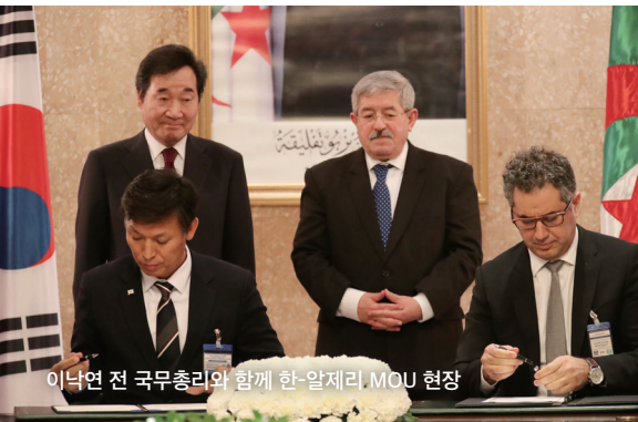
이낙연 전 국무총리와 함께 한-알제리 MOU 현장