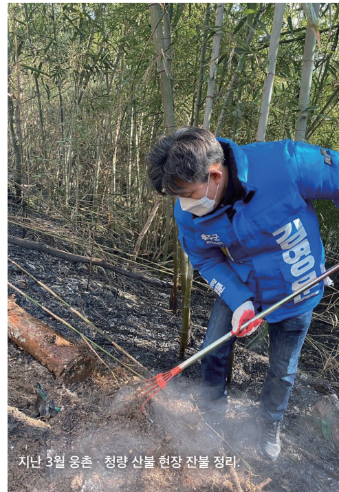
지난 3월 응촌·청량 산불 현장 진불 정리.