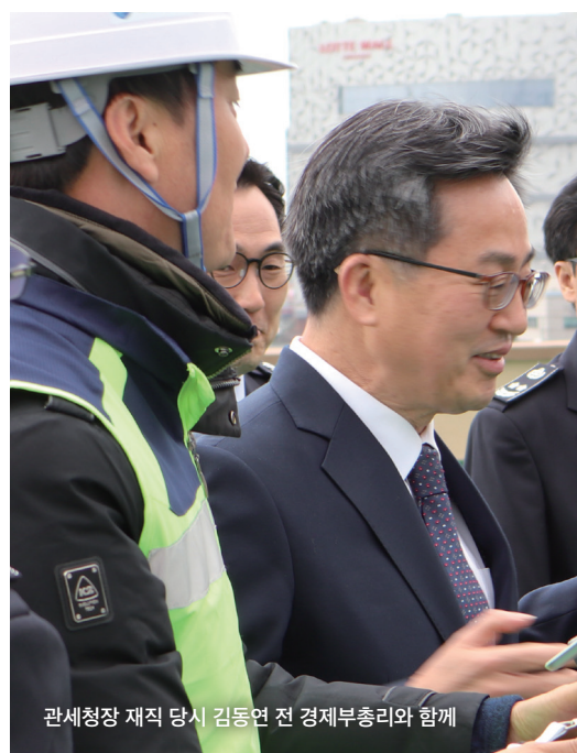
관세청장 재직 당시 김동연 전 경제부총리와 함께