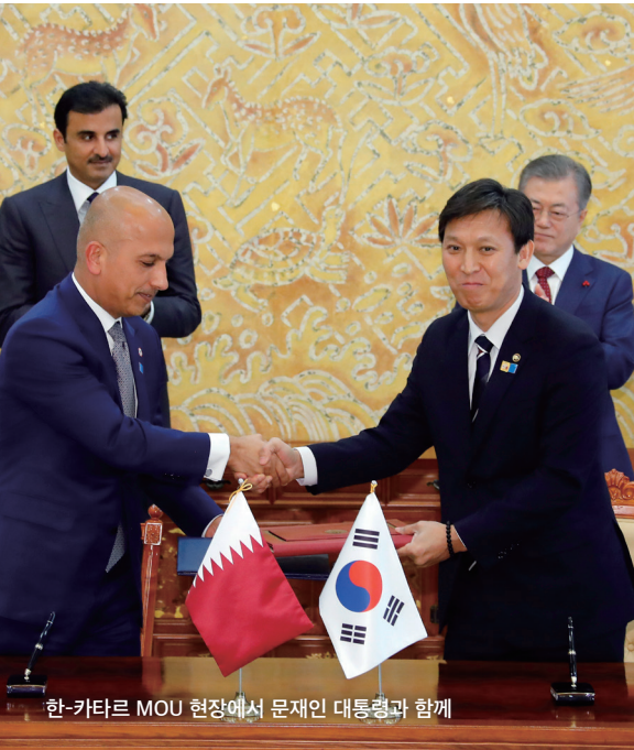
한-카타르 MOU 현장에서 문재인 대통령과 함께