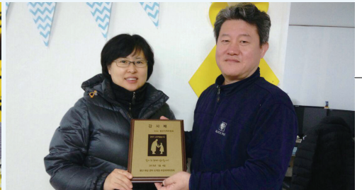
▲ 화상 경마장주방대책위로부터 감사패를 수상