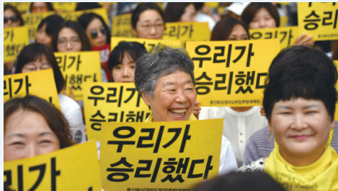
▲ 도박장 싸움에서 승리해 기뻐하는 주민들