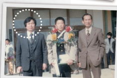
영고중 졸업식 - 선생님 감사합니다