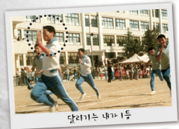
달리기는 내가 1등