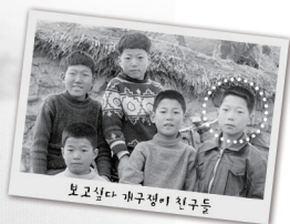
보고싶다 개구쟁이 친구들