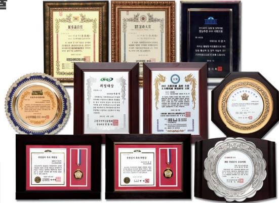
국정감사 우수의원상(12.11.21) 2013 국정감사 우수의원상(13.11.26) 국정감사 우수의원상(15.12.10) 국정감사 우수국회의원상(12.11.23) 국정감사 우수국회의원상(13.12.24) 국정감사 최우수의원상(15.12.16) 국회의원환칭대상(13.06.18) 우수국회의원연구단체 국회의원상(14.02.28) 국정감사 우수국회의원상(15.12.17) 의정대상(13.06.28) 우수국회의원국회의장상(14.12) 우수국회의원국회의장상(15.03.20) 모범우수국회의원(13.08.24) 대한민국 의정대상(15.03.20)