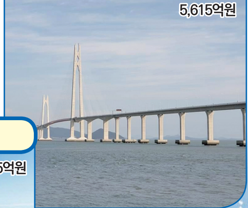
05 자라대교 (안좌 ~ 자라도)