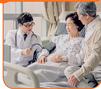
12 목포대의과대학교 유치