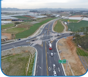
09 현경~해제간 국도 (용정교차로)