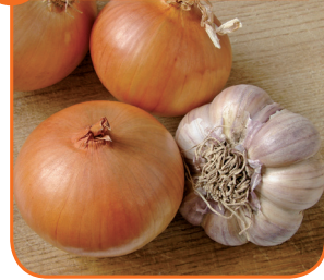
11 농산물 가격 안정화