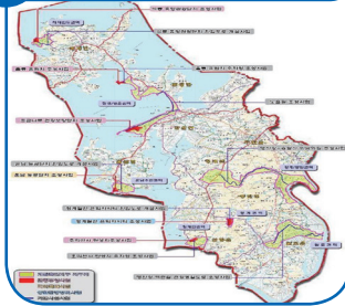
10 무안 해안 관광일주도로