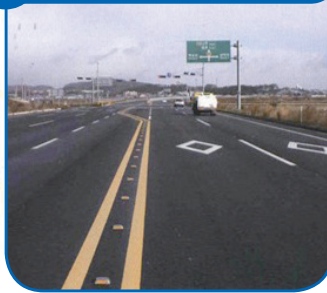
13 목포~일로 4차선도로