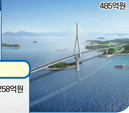
04 암태 ~ 추포 대교