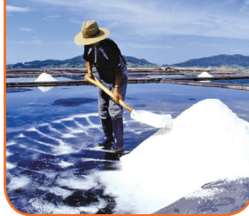
02 소금가격 안정화