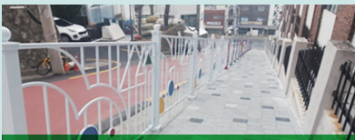
어린이 보호구역 개선 (동학로 개선, 옐로우 카펫, 노란신호등) 총사업비 5.9억원