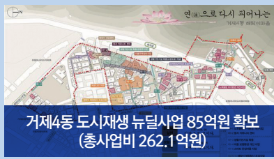
거제4동 도시재생 뉴딜사업 85억원 확보 (총사업비 262.1억원)