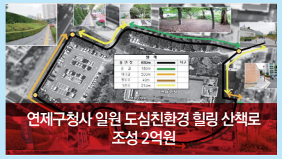
연제구청사 일원 도심친환경 힐링 산책로 조성 2억원