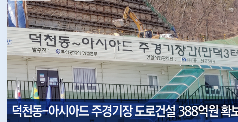
덕천동~아시아드 주경기장 도로개설 388억원 확보