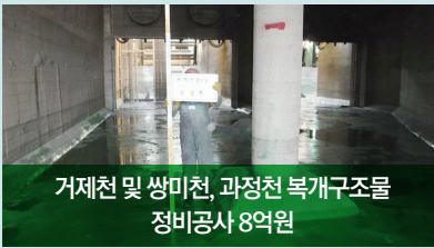
거제천 및 쌍미천, 과정천 복개구조물 정비공사 8억원