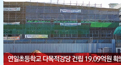
연일초등학교 다목적강당 건립 19.09억원 확보