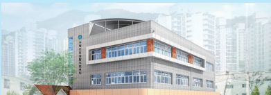
거제건강생활지원센터 건립 6.4억원 확보 (총사업비 13.5억원)