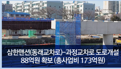
삼한맨션(동래교차로)-과정교차로 도로개설 88억원 확보 (총사업비 173억원)