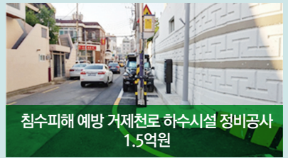
침수피해 예방 거제천로 하수시설 정비공사 1.5억원