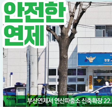
부산연제서 연산파출소 신축확장 22%