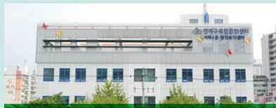
연제구 복합문화센터 내진보강사업 4억원