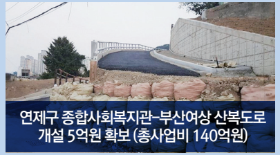
연제구 종합사회복지관-부산여상 산복도로 개설 5억원 확보 (총사업비 140억원)