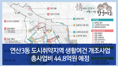
연산3동 도시취약지역 생활여건 개조사업 총사업비 44.8억원 예정