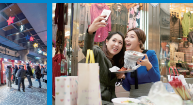
※상기 이미지는 이해를 돕기위한 이미지입니다.