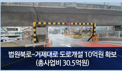
법원북로-거제대로 도로개설 10억원 확보 (총사업비 30.5억원)