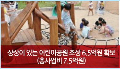
상상이 있는 어린이공원 조성 6.5억원 확보 (총사업비 7.5억원)