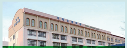
거학초등학교 노후 외부창호 교체 6.2억원 확보 (총사업비 7.6억원)