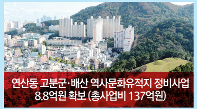
연산동 고분군·배산 역사문화유적지 정비사업 8.8억원 확보 (총사업비 137억원)