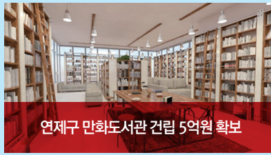
연제구 만화도서관 건립 5억원 확보