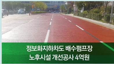
정보화지하차도 배수펌프장 노후시설 개선공사 4억원