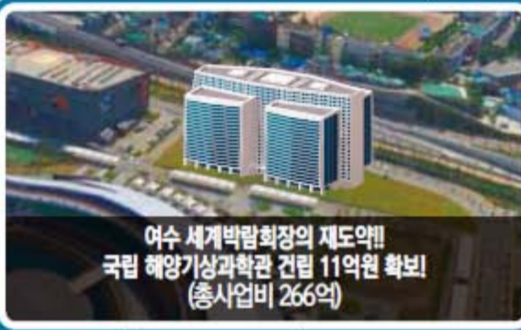
여수 세계박람회장의 재도약! 국립 해양기상과학관 건립 11억원 확보! (총사업비 266억)