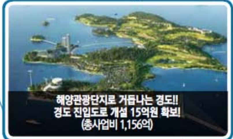
해양관광단지로 거듭나는 경도!! 경도 진입도로 개설 15억원 확보! (총사업비 1,156억)

원도심 하수관거 정비사업 27억원 (총사업비 153억) 문수동 하수관로 정비 2억원 (총사업비 82억)