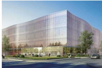
▲ 일본 요코하마 소재 애플 R&D센터 조감도