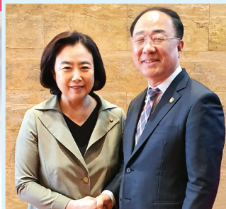
홍남기 경제부총리와 정책협의