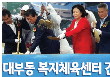
대부동 복지체육센터 건립