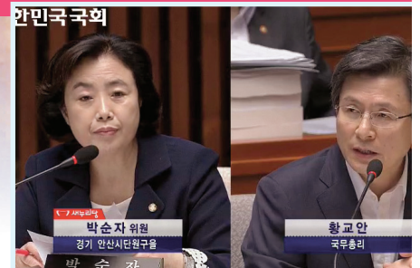
황교안 국무총리에게 신안산선 조기착공 촉구(2016.7.25)