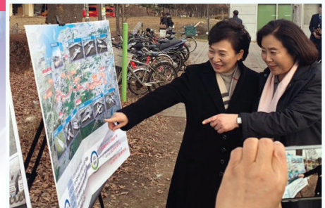
국토교통부 김현미 장관과 함께 안산중앙역 현장(2018.12.5)