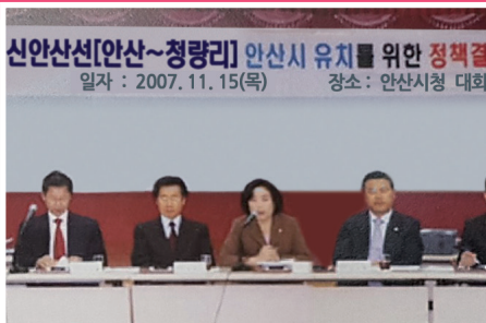
신안산선 안산유치 운동 (2007.11.15)