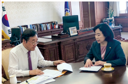
국무총리실을 방문하여 이낙연 국무총리와 정책협의