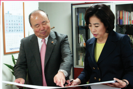
국토해양부 정종환 장관과 논의 (2008.9.11)