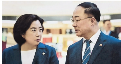
홍남기 경제부총리와 정책협의