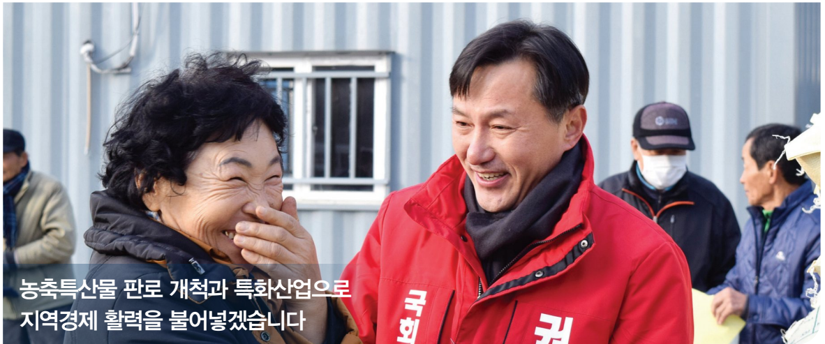
농축특산물 판로 개척과 특화산업으로 지역경제 활력을 불어넣겠습니다