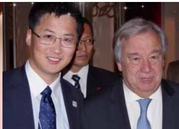
[안토니우 구테흐스 유엔사무총장과 함께]