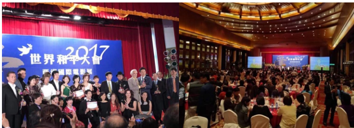
[아시아국제영화제 집행위원장으로 활동]