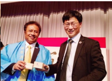
[팔라우대통령 토마스 레멩게사우]