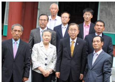
[반기문 전 유엔사무총장과 함께]