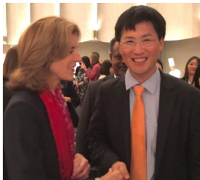
[존 F 케네디 딸 캐롤라인 케네디와 함께]

인생은 얼마만큼 오래살았느냐가 문제가 아니다. 얼마만큼 의미있고 가치있게 살았느냐의 문제다 그것은 얼마만큼 이웃을 위해서 그것이 고통받고 어려움에 처한 사람들을 위해 살았느냐의 문제다(김대중 마지막 일기 “인생은 아름답고 역사는 발전한다” 에서 인용)는 말은 늘 생각하는 구절입니다. 이희호 여사님으로부터 경천애인(敬天愛人)이라는 글귀를 받은 적이 있습니다.