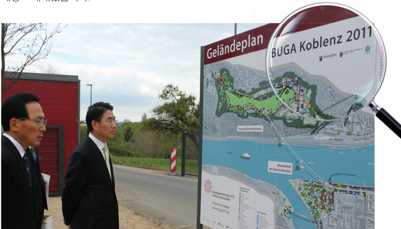
* 독일 코블렌츠 박람회

대한민국 1년 예산의 약 10%에 해당하는 50조 원이 5년간 도시재생과 관련된 예산입니다. 이런 예산을 확보해 본 경험은 노관규 가 가장 많습니다. 2023순천만국제정원박람회를 기반으로 성공적인 도시 재생을 위해서 필요하다면 특별법 제정도 해내겠습니다.