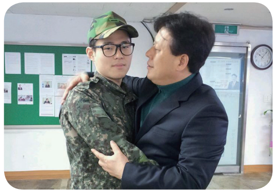
〈휴가 때 아들과 함께〉