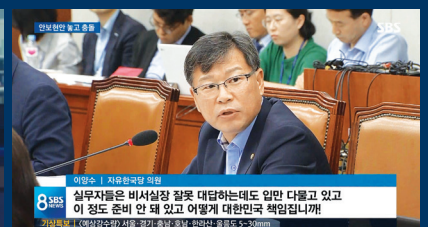
SBS '8 뉴스'