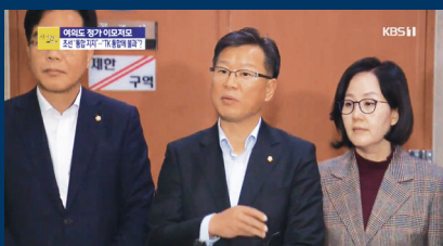
KBS '여의도 시사건건'