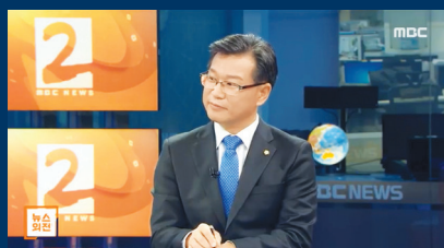
MBC '뉴스외전 와호장룡'