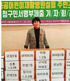
성남시민 1만명이 함께 한 어린이재활병원 조례 청구