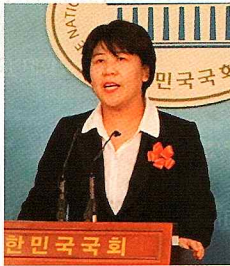
서울공항이전, 노동조건 개선 등 다양한 현안에 대한 국회브리핑