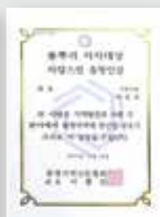
자랑스런 충청인상 대상