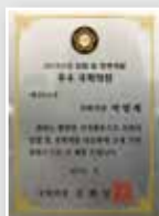
입법 및 정책개발 우수 국회의원상