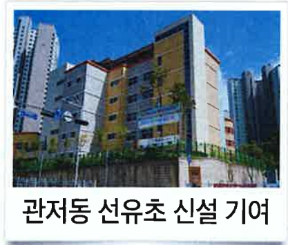
관저동 선유초 신설 기여