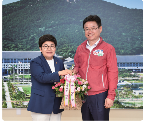
스승의날 인사 _ 화령중학교 수학선생님이셨던 이철우 도지사(19.05.14)