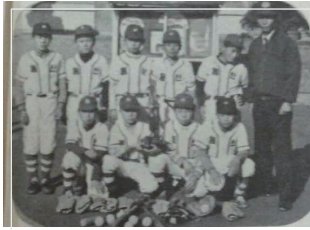
▲ 동산초등학교 야구부시절