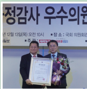
▲ 2018 국정감사 우수의원