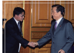
▲ 청와대 비서관 시절