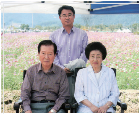
▲ 구리 한강변 코스모스밭에서 기념촬영