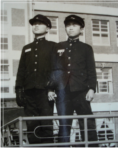
▲ 중학교 쌍둥이 형과 함께