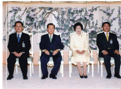
▲ 퇴임 기념촬영