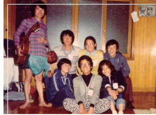
▲ 1980년도 대학시절