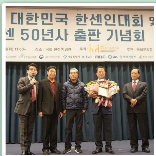
▲ 대한민국 한센인대회 특별상