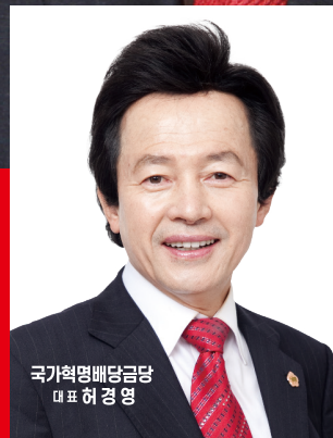
국가혁명배당금당 대표 허경영